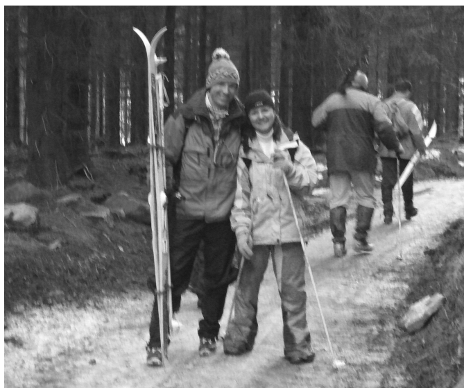
„Tak a teď krásný úsměv na blátě nebo ti dám na gatě!“☺