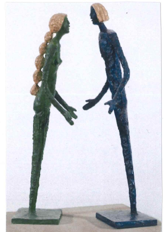
Ctirad a Šárka